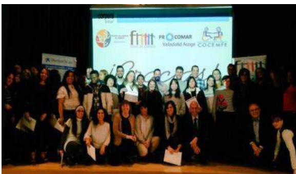
Clausura 2018, de los cursos de formación del Programa de inserción laboral Incorpora de la Obra Social Caixa en Valladolid.

Una visita sorpresa para los más peques, Defaniva, una protectora de animales, les enseña el respeto por los animales y la importancia de la adopción. Presentando algún perrete, que se convirtió en el